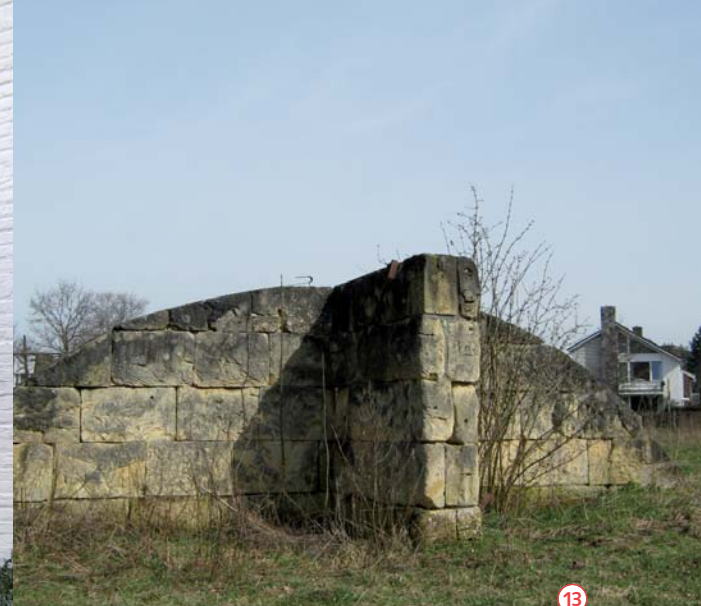
> Levensbol <